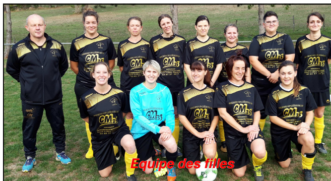
Equipe des filles