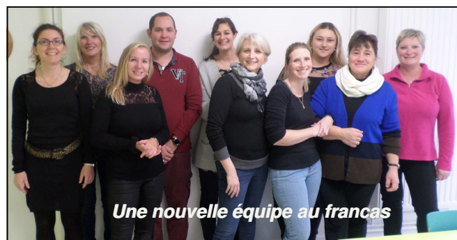
Une nouvelle équipe au francas

C' est super !!! Nous avons emménagé dans des locaux neufs.