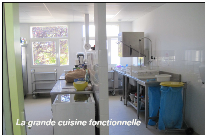
La grande cuisine fonctionnelle