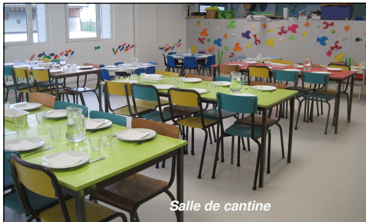
Salle de cantine