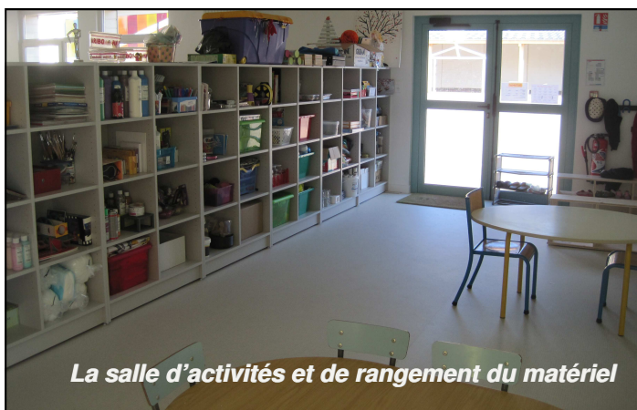
La salle d'activités et de rangement du matériel