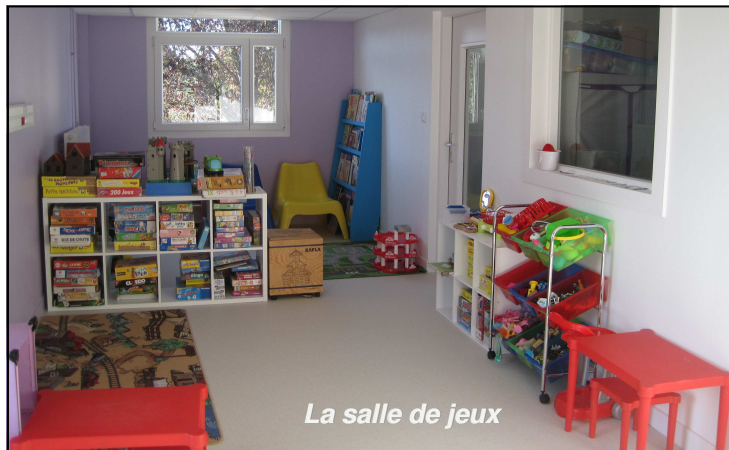
La salle de jeux